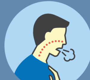
FALTA DE RESPIRACIÓN